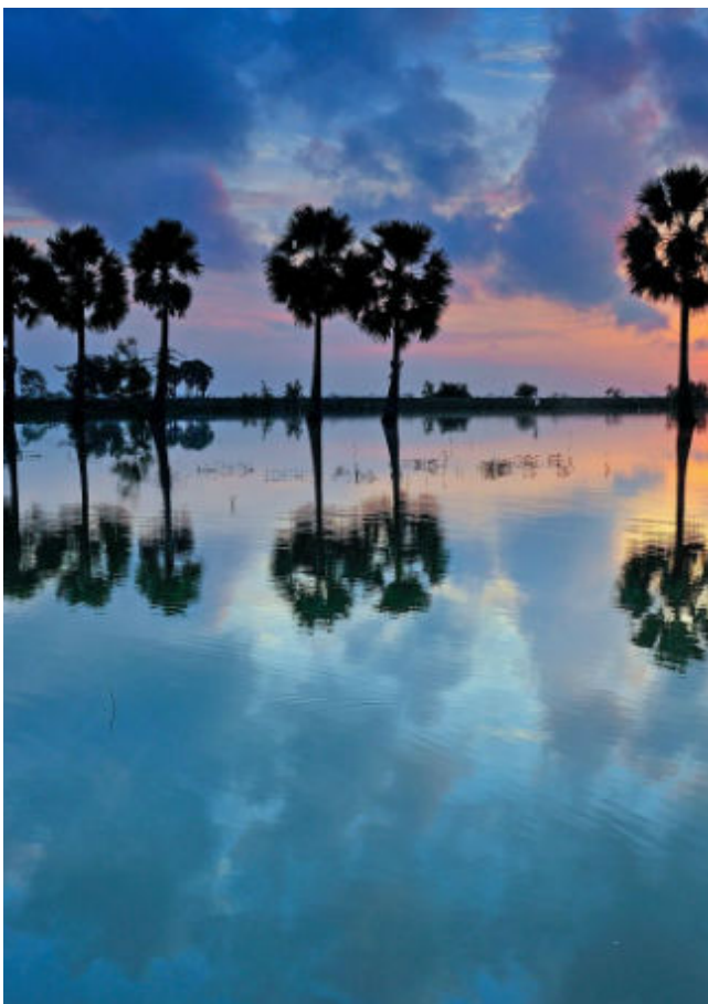
Bình minh ở "xứ sở thất nớt"

Và ở nơi tươi đẹp ấy, Alphanam đang chung tay kiến tạo một dự án quy mô, đẳng cấp với mong muốn mang đến cuộc sống tốt đẹp và hiện đại hơn cho những con người bình dị... Tọa lạc giữa thành phố Long Xuyên, Golden City An Giang sẽ là điểm nhấn quy hoạch hàng đầu, là trung tâm văn hóa mới dành cho người dân miền Tây Nam Bộ!