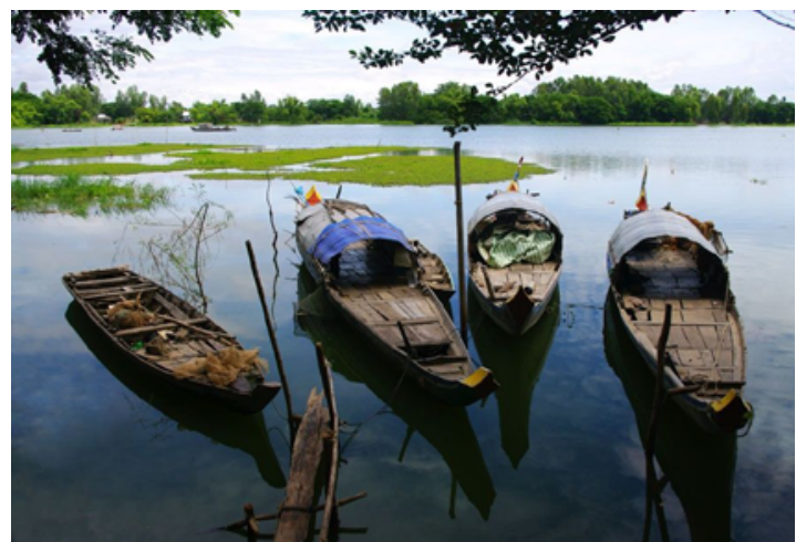
Búng Bình Thiên - hồ nước mênh mang mùa nước nổi - Ảnh: Frank Dang