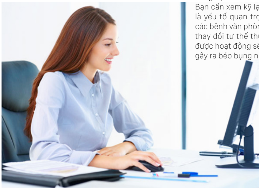
Ngồi đúng tư thế là yếu tố quan trọng

Ngồi làm việc không đúng cách có thể tăng khả năng bị chấn thương ở vai, cổ tay, lưng và cổ. Bạn cần xem kỹ lại tư thế ngồi của mình, vì đây là yếu tố quan trọng hàng đầu giúp bạn tránh các bệnh văn phòng. Hãy chú ý ngồi thẳng lưng, thay đổi tư thế thường xuyên để phần cơ bụng được hoạt động sẽ tránh việc mỡ tụ lại một chỗ, gây ra béo bụng nhé.