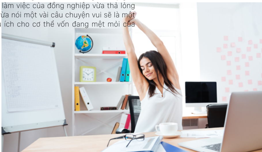
Nên thực hiện một vài động tác đơn giản

Với một vài động tác đơn giản như: đứng lên ngồi xuống nhiều lần, hít thở thật sâu, hay lắc hông cũng sẽ giúp ích rất tốt cho chân và cơ thể của bạn. Vì làm trong văn phòng ngồi máy tính nhiều nên tốt hơn hết, các bạn phải tự tạo cho mình cơ hội được vận động như đi cầu thang bộ hay ghé qua bàn làm việc của đồng nghiệp vừa thả lỏng cơ thể, vừa nói một vài câu chuyện vui sẽ là một việc hữu ích cho cơ thể vốn đang mệt mỏi của bạn.