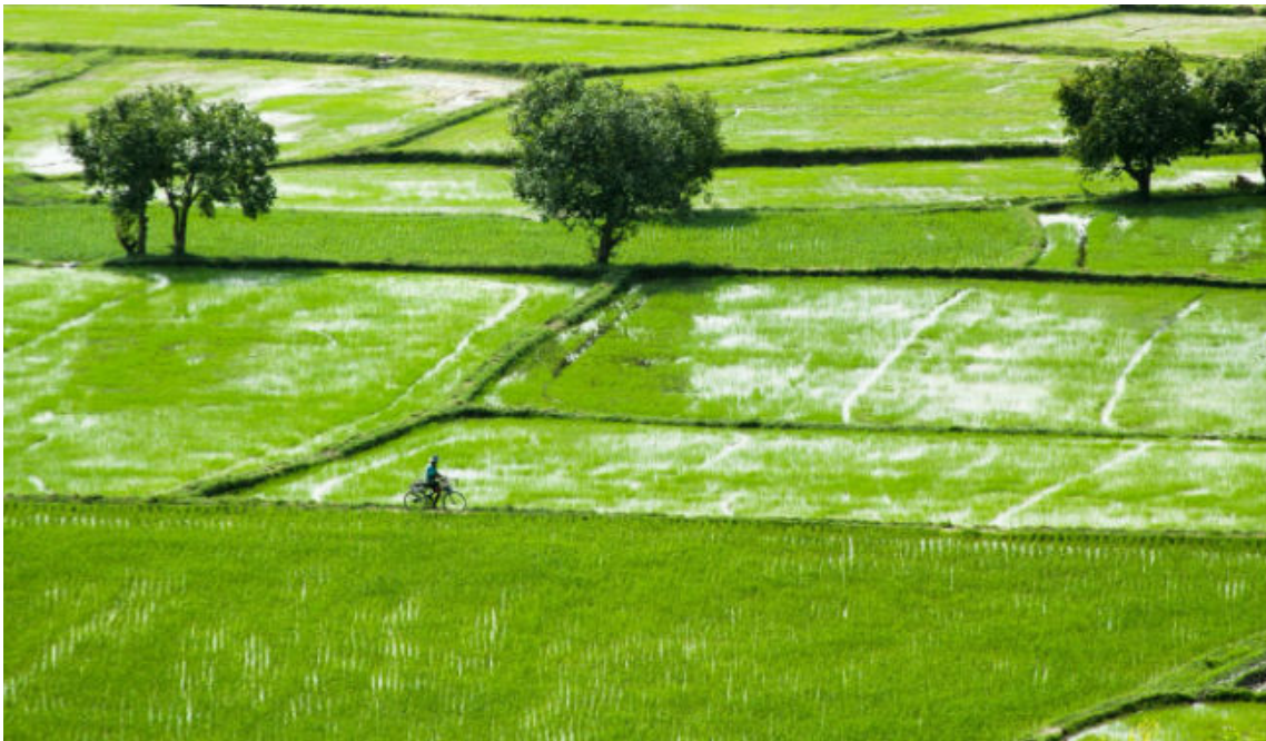
Cánh đồng Tà Pạ bát ngát, mênh mông

Thiên nhiên và con người ở An Giang không chỉ mang những nét đặc trưng của miền Tây Nam Bộ mà còn có những vẻ đẹp riêng biệt của mình. Tất cả đã hội tụ ở đất An Giang, tạo nên một mảnh đất bình dị, đơn sơ và mộc mạc không lẫn với bất kỳ nơi đâu. An Giang dường như chẳng chút đổi thay, cứ mãi trường tồn cùng thời gian như thế. Vậy nên, mỗi khi về với An Giang, những người lữ khách phương xa lại cứ nao nao trong lòng, không khỏi thổn thức vì miền đất nơi đây